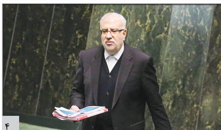
در صحن علنی مجلس؛ اوجی: ۶۰۰ تحریم جدید نفتی در دولت سیزدهم