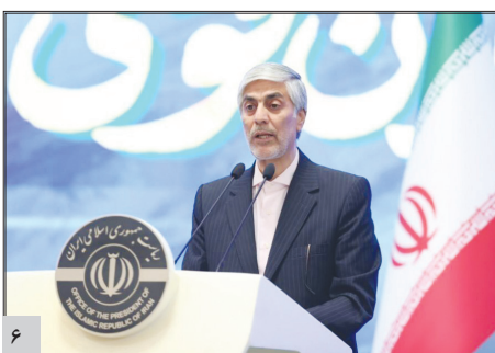
هاشمی: وزارت ورزش از مبارزه با فساد در فوتبال حمایت می کند