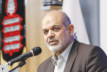
وزیر کشور: شهید جمهور با جدیت