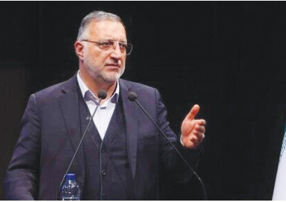
شهردار تهران ضمن تبریک و تسلیت به مناسبت شهادت ربیسی

جمهور و هیات همراه در سانحه سقوط بالگرد گفت: خدمت خستگی‌ناپذیر از دیگر ویژگی‌های شهید آیت‌الله رئیسی بود، هیچ‌وقت در خدمت به مردم خسته نمی‌شد و همواره پیگیر امور آنها بود.