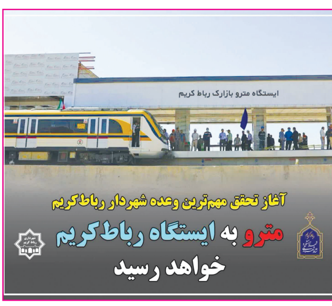
آغاز تحقق مهم ترین وعده شهردار رباط کریم مترو به ایستگاه رباط کریم خواهد رسید

عملیات اجرایی احداث مترو ایستگاه بازارک شهر رباط کریم روز سه شنبه با حضور مردم و مسئولان آغاز شد.