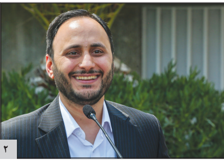
سخنگوی دولت: بخشی از حقایق